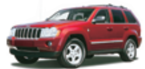
JEEP グランドチェロキー