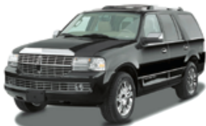
リンカーン ナビゲーター