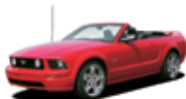
フォード マスタング