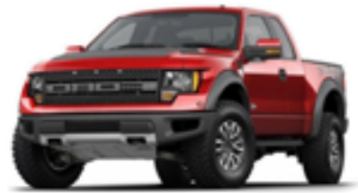
フォード F-150ラプター