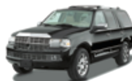
リンカーン ナビゲーター