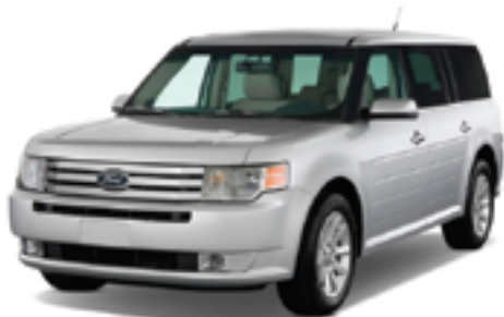
フォード フレックス