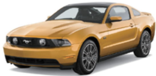
フォード マスタングV8