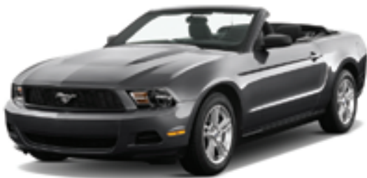
フォード マスタングV6