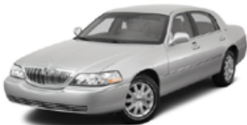
リンカーン タウンカー