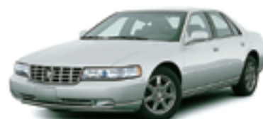
キャデラック セビル