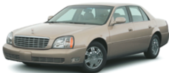
キャデラック ドゥビル