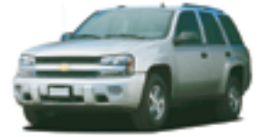
シボレー トレイルブレイザー