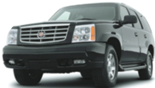
キャデラック エスカレード