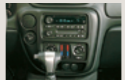
トレイルブレイザー