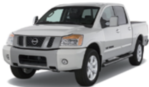
USニッサン タイタン