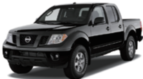
USニッサン フロンティア