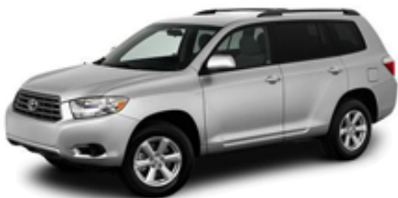
USTトヨタ ハイランダー