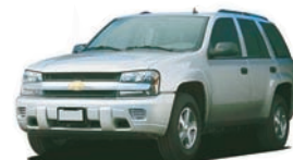
シボレー トレイルブレイザー