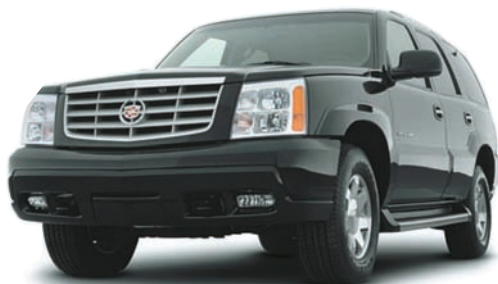
キャデラック エスカレード