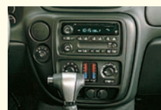
トレイルブレイザー