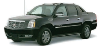
キャデラック エスカレード EXT