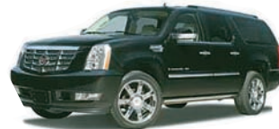
キャデラック エスカレード ESV