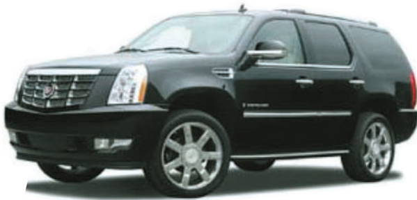
キャデラック エスカレード